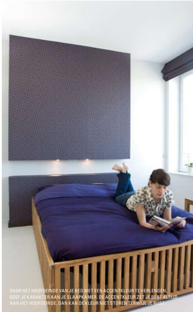
DOOR HET HOOFDEINDE VAN JE BED MET EEN ACCENTKLEUR TE VERLENGEN, GEEF JE KARAKTER AAN JE SLAAPKAMER. DE ACCENTKLEUR ZET JE BEST ALTIJD AAN HET HOOFDEINDE, DAN KAN DE KLEUR NIET STOREN TERWIJL JE RUST.