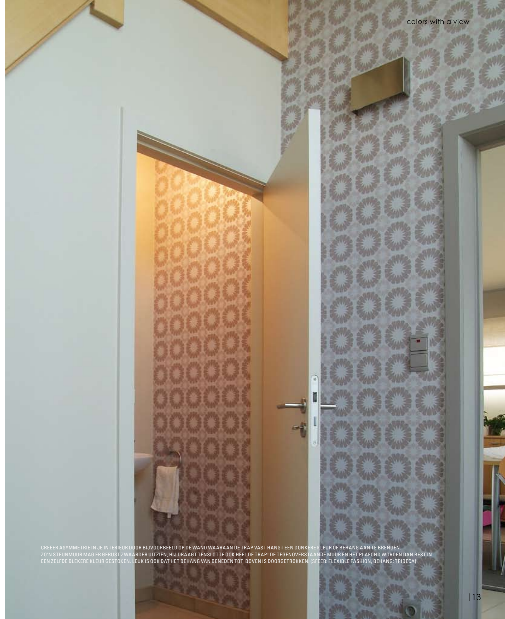
CREËER ASYMMETRIE IN JE INTERIEUR DOOR BIJVOORBEELD OP DE WAND WAARAAN DE TRAP VAST HANGT EEN DONKERE KLEUR OF BEHANG AAN TE BRENGEN. ZO 'N STEUNMUUR MAG ER GERUST ZWAARDER UITZIEN, HIJ DRAAGT TENSLOTTE OOK HEEL DE TRAP! DE TEGENOVERSTAANDE MUUR EN HET PLAFOND WORDEN DAN BEST IN EEN ZELFDE BLEKERE KLEUR GESTOKEN. LEUK IS OOK DAT HET BEHANG VAN BENEDEN TOT BOVEN IS DOORGETROKKEN. (SFEER: FLEXIBLE FASHION, BEHANG: TRIBECA)